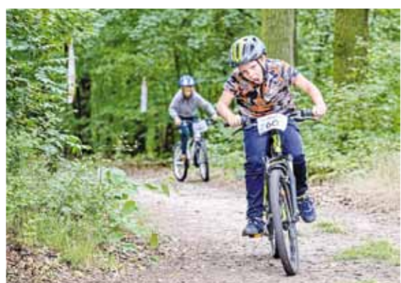
Poslední prázdninovou neděli se již tradičně konaly dětské závody na Kozinci.

Protože organizační tým hýřil sebevědomím z povedených předchozích ročníků, připravil novinku v podobě běžeckých závodů. V průběhu léta se provedla každoroční drobná údržba „trailů“: zametání cestiček, posekání trávníku na place, naplnili jsme a navěsili nové pytly slámy jako ochranu stromů před poškozením od závodních strojů. Už zbývalo jen sehnat 16 sad pohárů a nespočet medailí.